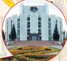
Челябинский государственный академический театр драмы им. Н. Орлова ул. площадь Революции, 6