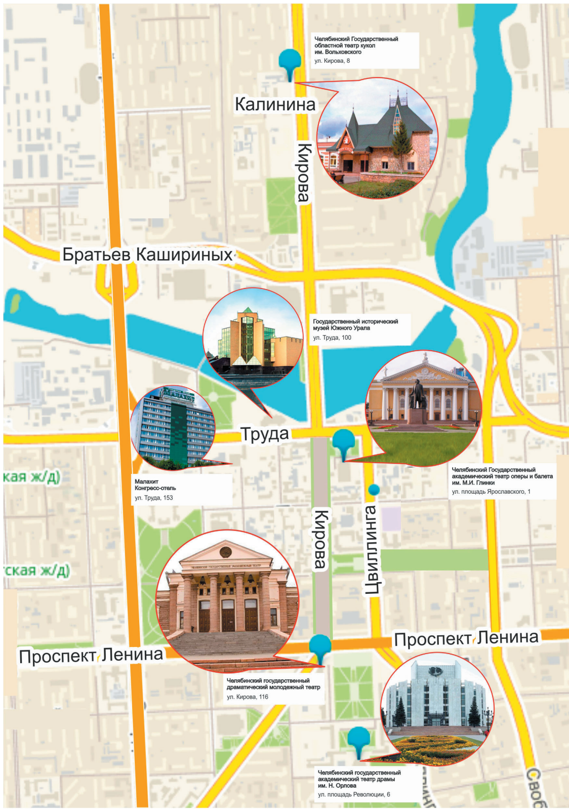
Челябинский Государственный областной театр кукол им. Вольховского ул. Кирова, 8