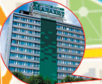
Малахит Конгресс-отель ул. Труда, 153