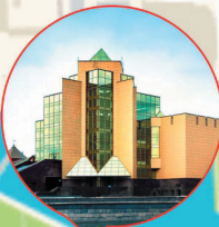
Государственный исторический музей Южного Урала ул. Труда, 100