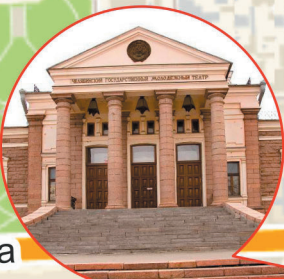
Челябинский государственный драматический молодежный театр ул. Кирова, 116